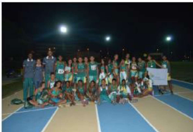
Campeonato Maranhense CAIXA Mirins de Atletismo