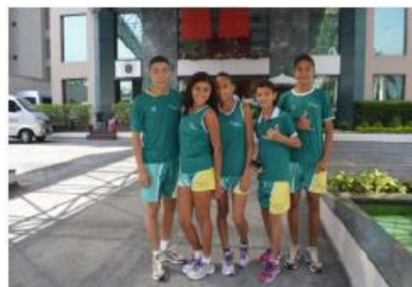
Participação na 21ª São Silvestrinha