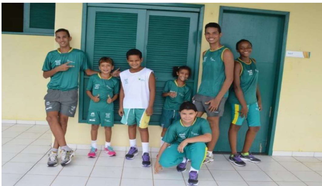
Todos os alunos, devidamente uniformizados de acordo com sua modalidade.

Com isso conseguimos atingir mais uma meta prevista para esse projeto pois além de ser uma economia para as famílias, o uso do uniforme é também um item de suma importância na segurança dos alunos no trajeto de casa para a EC e vice e versa.