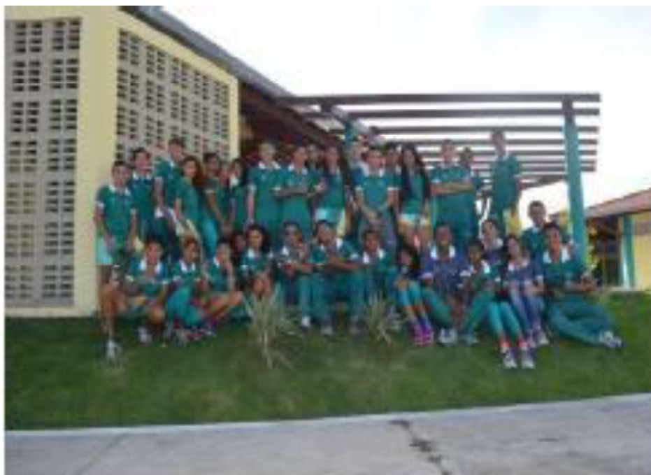
Campeonato Maranhense CAIXA Mirins de Atletismo