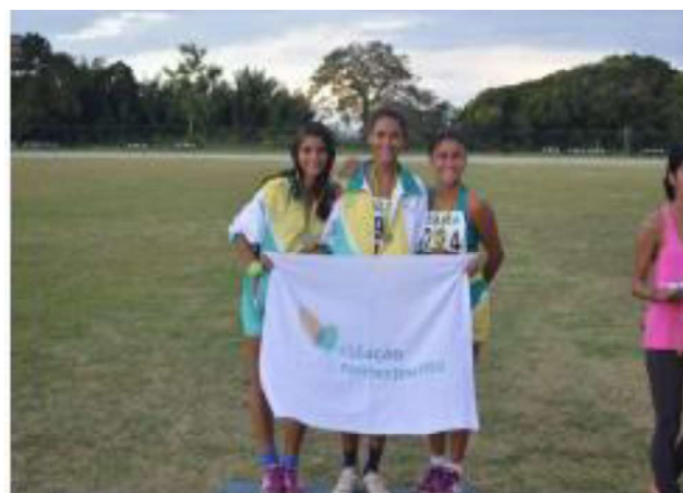
Campeonato Maranhense CAIXA Mirins de Atletismo